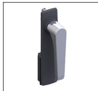
TZ504 Klinkengr.+Schild o.Schloss EAN Art.-Nr. 2CPX010488R9999 Listenpreis 48.90 €