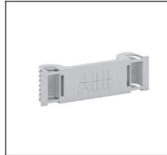
CZ9P16 Leitungshalter Compact CA EAN Art.-Nr. 2CPX052556R9999 Listenpreis 4.15 €