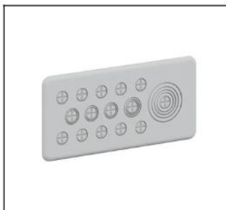
CZF4 Flansch für Rohreinführ.oben EAN Art.-Nr. 2CPX052438R9999 Listenpreis 23.70 €