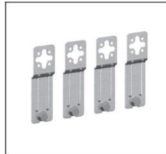
CZ1P4 Außenbefestigungslaschen (4St.) EAN Art.-Nr. 2CPX052459R9999 Listenpreis 30.90 €