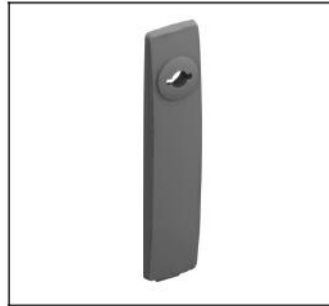
TZ507 Schlüsselsch. Doppelb.3/5mm EAN Art.-Nr. 2CPX010491R9999 Listenpreis 9.00 €