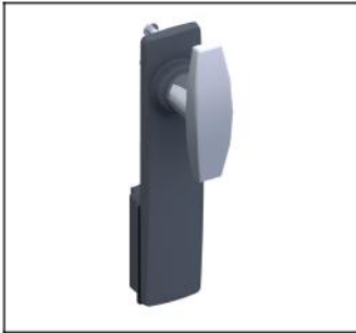
TZ506 Knebelgr.+Schild o.Schloss EAN Art.-Nr. 2CPX010490R9999 Listenpreis 36.70 €