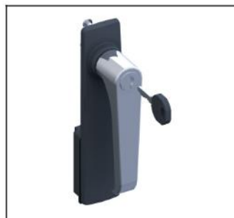
TZ503 Klinkengr.+Schild m.Schloss EAN Art.-Nr. 2CPX010487R9999 Listenpreis 70.00 €