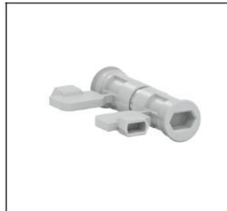
CZ2 Schrankverbindungs-Schrauben EAN Art.-Nr. 2CPX052460R9999 Listenpreis 12.40 €