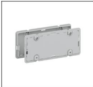
CZ4 Isolierahmen oben/unten EAN Art.-Nr. 2CPX052462R9999 Listenpreis 19.10 €