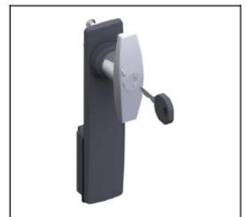
TZ505 Knebelgr.+Schild m.Schloss EAN Art.-Nr. 2CPX010489R9999 Listenpreis 56.50 €