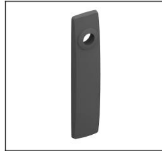
TZ508 Schlüsselsch. 3/4kt.+D Benz EAN Art.-Nr. 2CPX010492R9999 Listenpreis 9.00 €