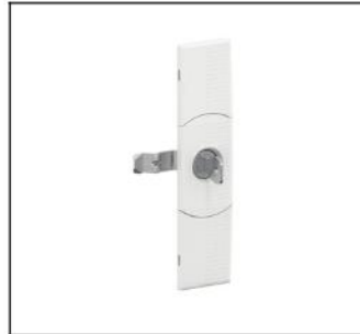
CZT2 Sicherheitsschloß EAN Art.-Nr. 2CPX052412R9999 Listenpreis 35.00 €