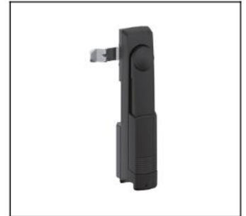
CZT5 Schwenkhebel f.Profilhalbzyl. EAN Art.-Nr. 2CPX052488R9999 Listenpreis 68.00 €