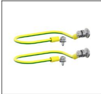
CZL61 Erdungsset KV Aufputz EAN Art.-Nr. 2CPX052449R9999 Listenpreis 17.05 €