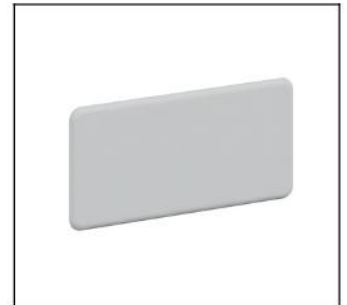
CZF3 Verschlußflansch EAN Art.-Nr. 2CPX052437R9999 Listenpreis 20.60 €